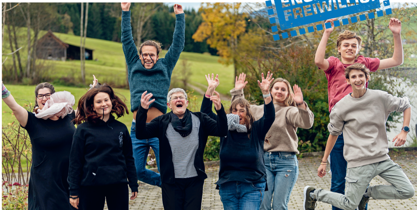
Freiwillige Helfer:innen Ferienlager