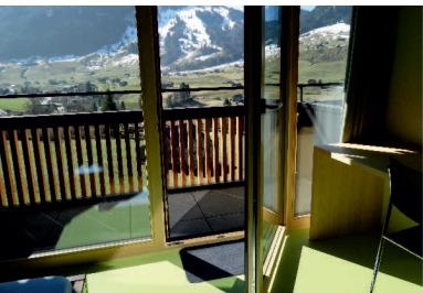
Einzelzimmer mit Balkon